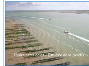
Tables ostréicoles - Estuaire de la Seudre

Un port « zéro pollution » : une nécessité en zone ostréicole !