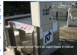
Pompe "eaux noires" Port de Saint-Denis d'Oléron

- en récupérant, pour traitement, les eaux noires et grises, les eaux de cale, les eaux de l'aire de carénage, les eaux pluviales, les eaux des installations sanitaires,