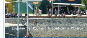
Equipements HQE Port de Saint-Denis d'Oléron

- en recrutant et en formant du personnel qualifié, - en informant 'en continu' les usagers du port sur la démarche 'zéro pollution'.